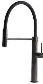
Mischbatterie Skin Gun Metal