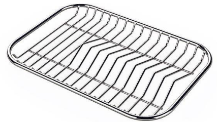
Tellerständer aus Edelstahl nur mit Zubehör 8644 003 verwendbar 8100 154