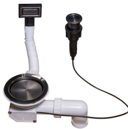
Automatischer Abfluss Space Push Gun Metal - PO