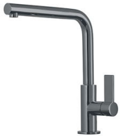
Mischbatterie Omega Gun Metal